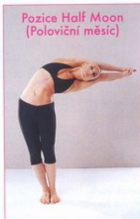
Pozice Half Moon (Poloviční měsíc)

do Spojených států a o dva roky později založil v Beverly Hills svou první školu Yoga College of India.