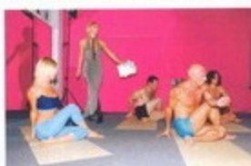
Ukázky Bikram jógy v dokonalém provedení