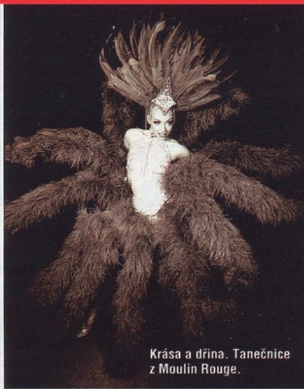
Krása a dřina. Tanečnice z Moulin Rouge.